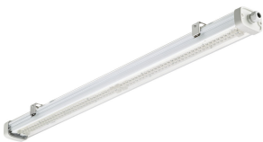
Pacific LED gen5, L1200