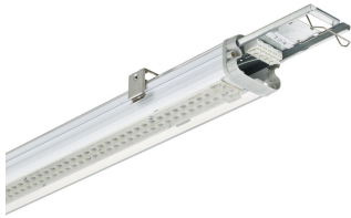
Pacific LED gen5 with push in 5-pole (P15) connecto